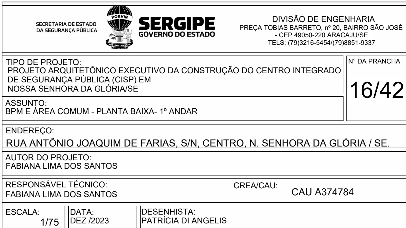
BLOCO BPM - PRANCHAS 15/42 A 20/42