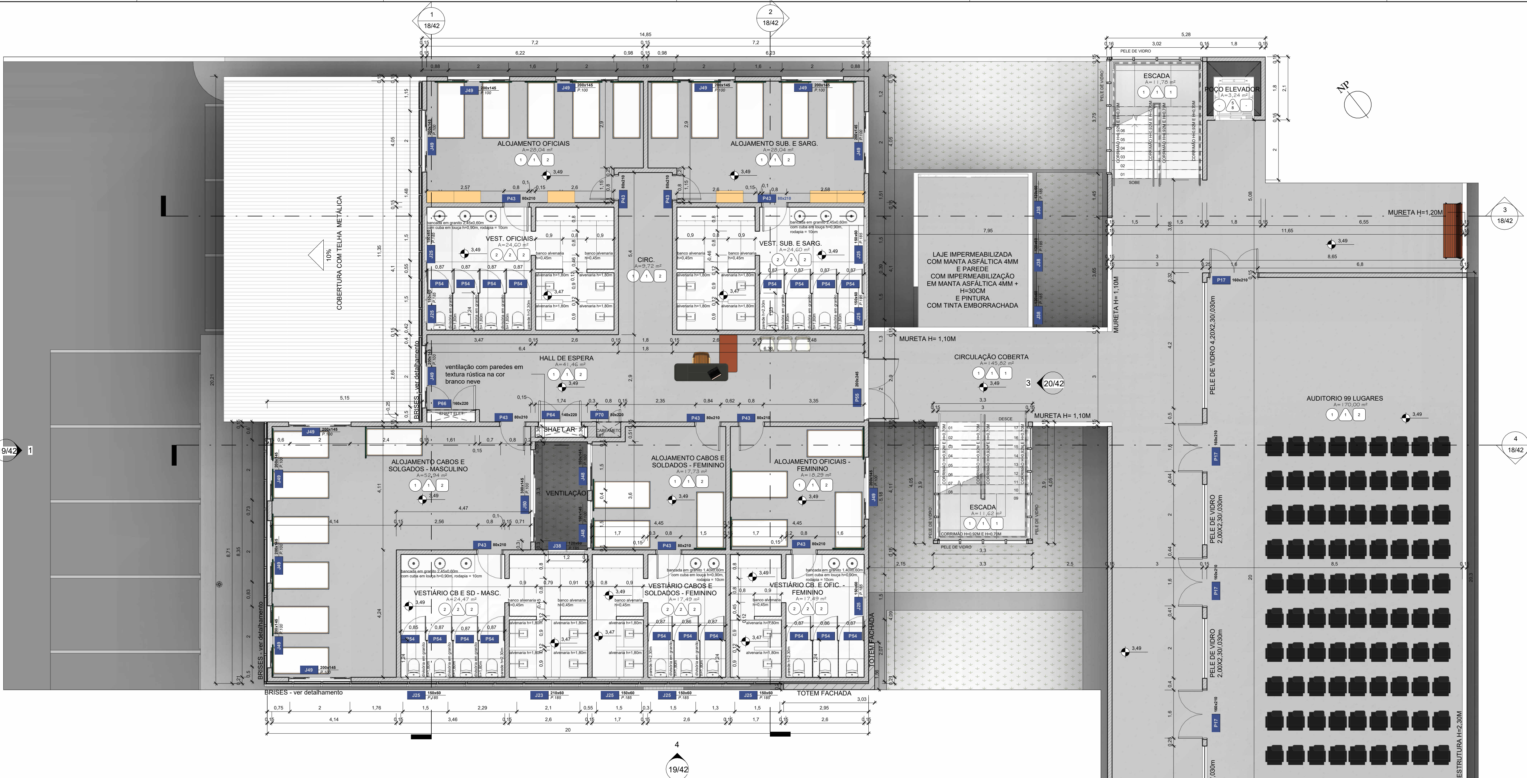
1 BPM - PLANTA BAIXA - 1º ANDAR ESCALA 1 : 75